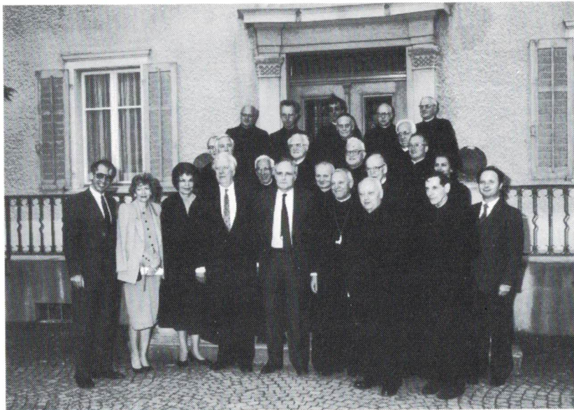
Begegnung mit dem Konvent

hat und nicht mit sensationshungrigen Journalisten. Immer wieder lässt er grosses persönliches Engagement durchblicken, betont den Wert einer umfassenden Allgemeinbildung und erinnert sich dankbar an vieles, was er am Sarner Kollegi damals gelernt hat. Die Fragestunde verfliegt im Nu, und die gut eingeübte Fragetaktik der Schüler erwirkt einen freien Tag: Das Pfingstweekende wird um einen Tag verlängert. Grosses Gedränge beim abschliessenden Apéro. Das hindert die sechs Studenten aus dem Tessin nicht, mit den illustren Gästen fürs Familienalbum zu posieren: Sie sind sichtlich stolz auf ihren «Consigliere federale».